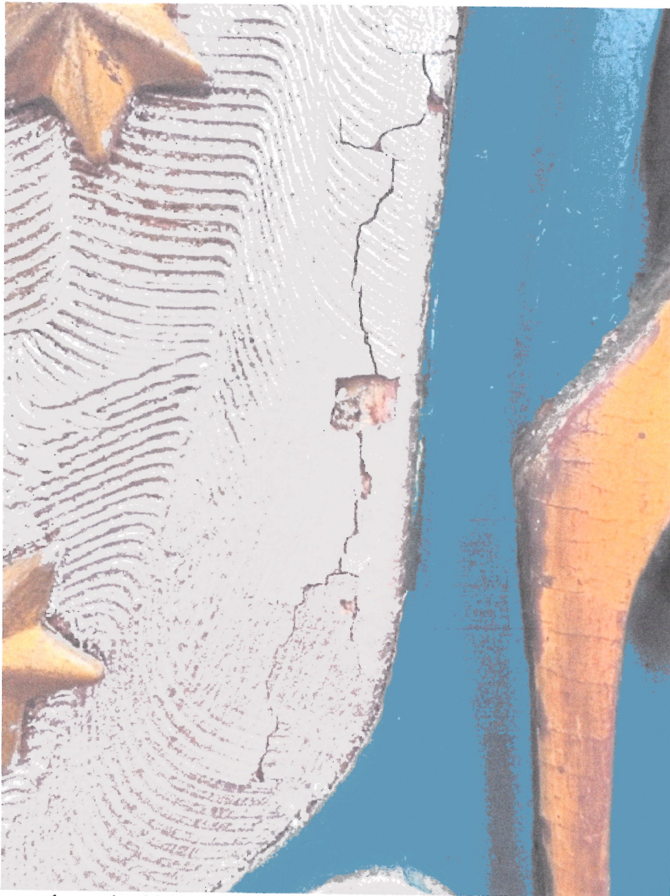
6. Stan zachowania obiektu – ubytki warstwy zaprawy, spękania.

WOJEWÓDZKI URZĄD OCHRONY ZABYTKÓW W WARSZAWIE Delegatura w Ostrołęce 07-400 Ostrołęka, ul. Kościuszki 16 tel./fax (029) 764-22-38