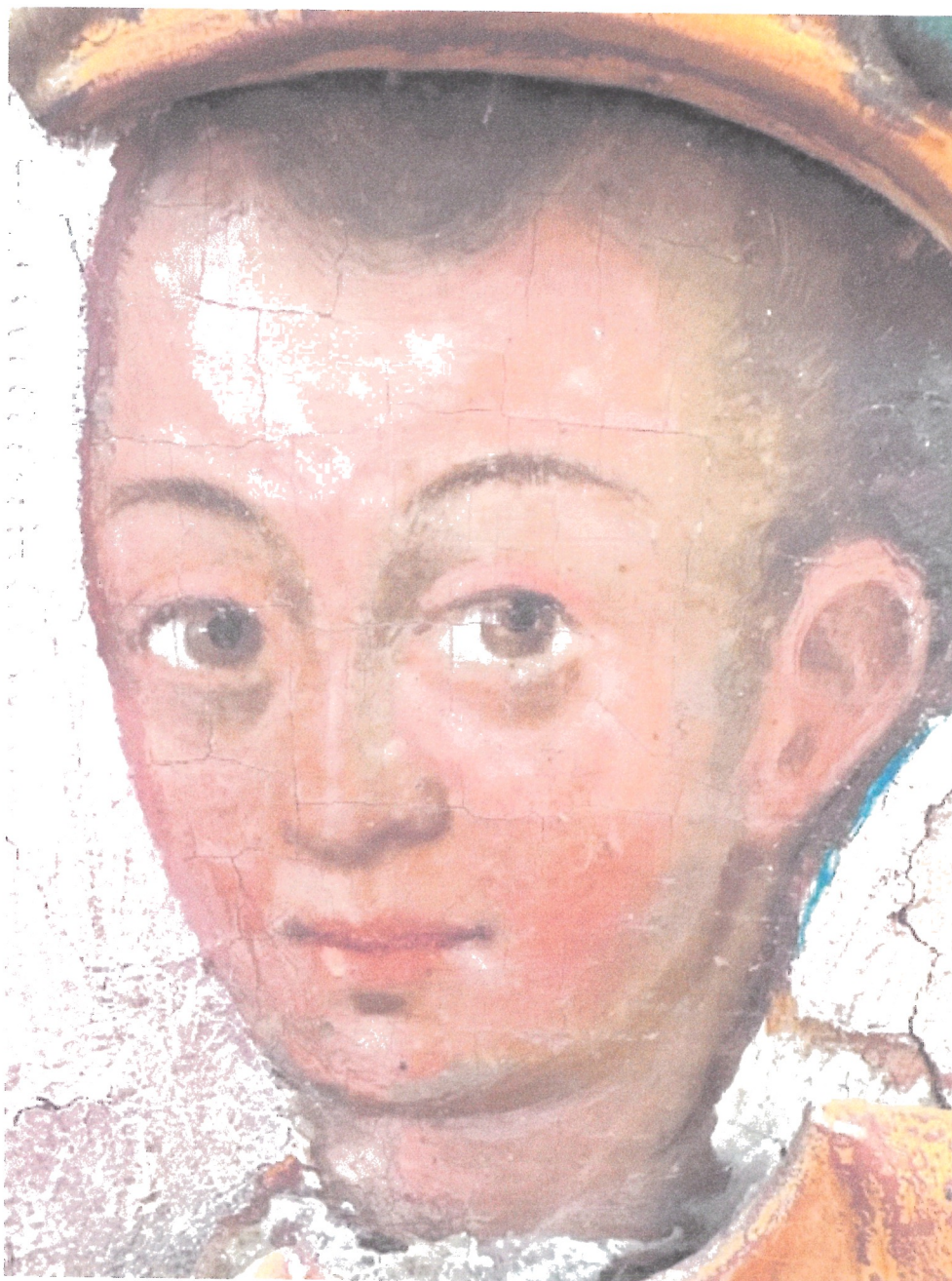
4. Stan obiektu przed konserwacją – detal.

WOJEWÓDZKI URZĄD OCHRONY ZABYTKÓW W WARSZAWIE Delegatura w Ostrołęce 07-400 Ostrołęka, ul. Kościuszki 16 tel./fax (029) 764-22-38