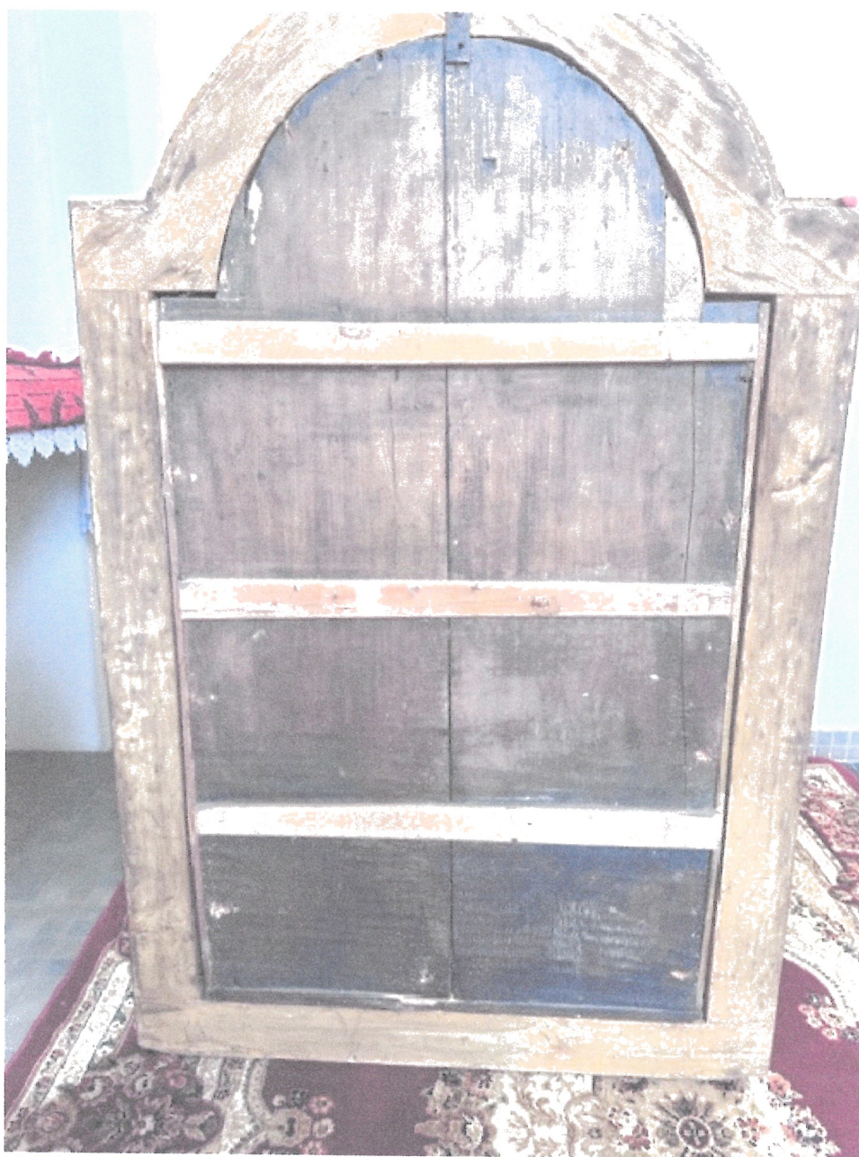
2. Stan obiektu przed konserwacją – odwrocie.

WOJEWÓDZKI URZĄD OCHRONY ZABYTKÓW W WARSZAWIE Delegatura w Ostrołęce 07-400 Ostrołęka, ul. Kościuszki 16 tel./fax (029) 764-22-38