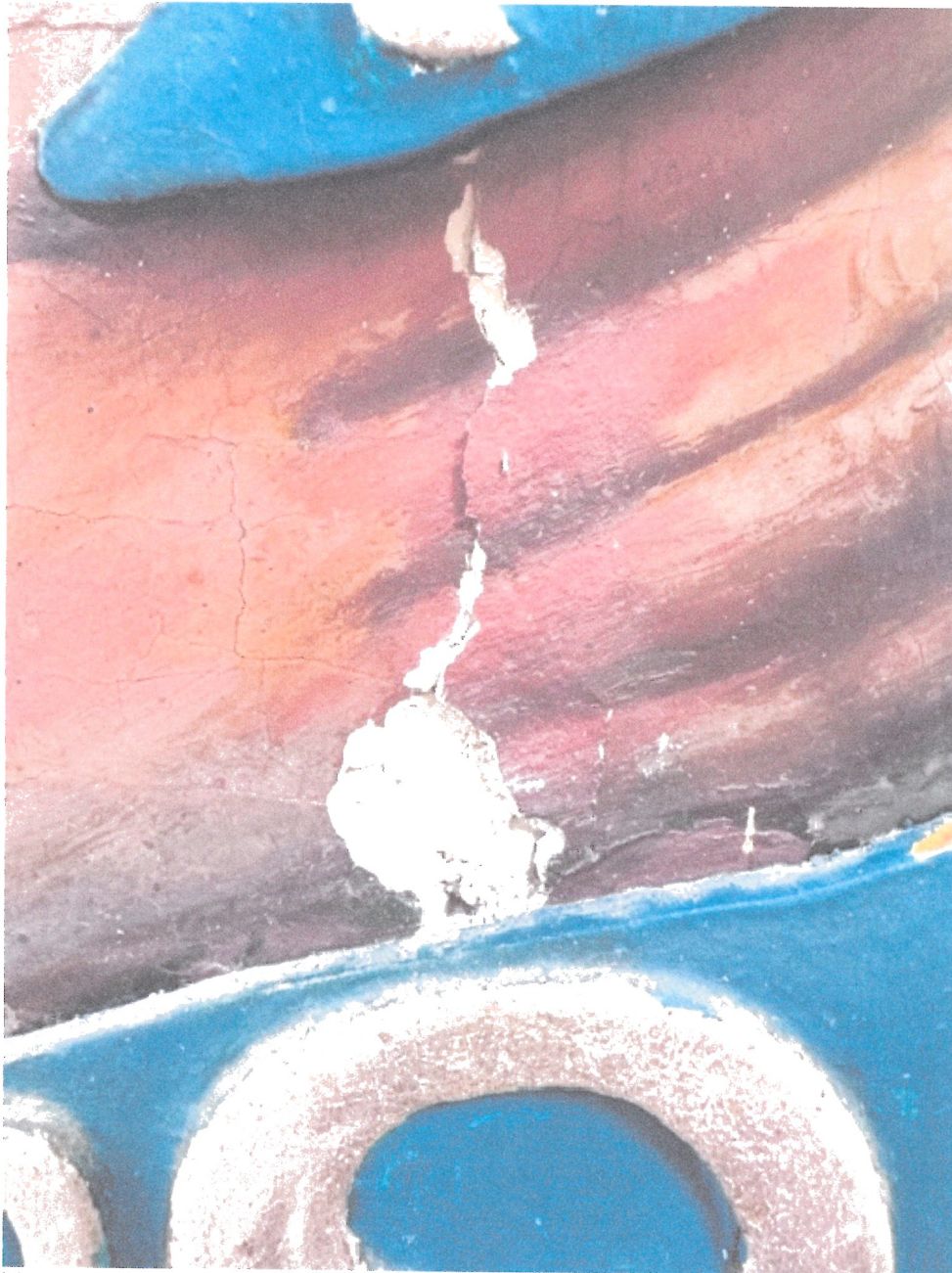
8. Ubytki w warstwie malarskiej i zaprawie.

WOJEWÓDZKI URZĄD OCHRONY ZABYTKÓW W WARSZAWIE Delegatura w Ostrołęce 07-400 Ostrołęka, ul. Kościuszki 16 tel./fax (029) 764-22-38