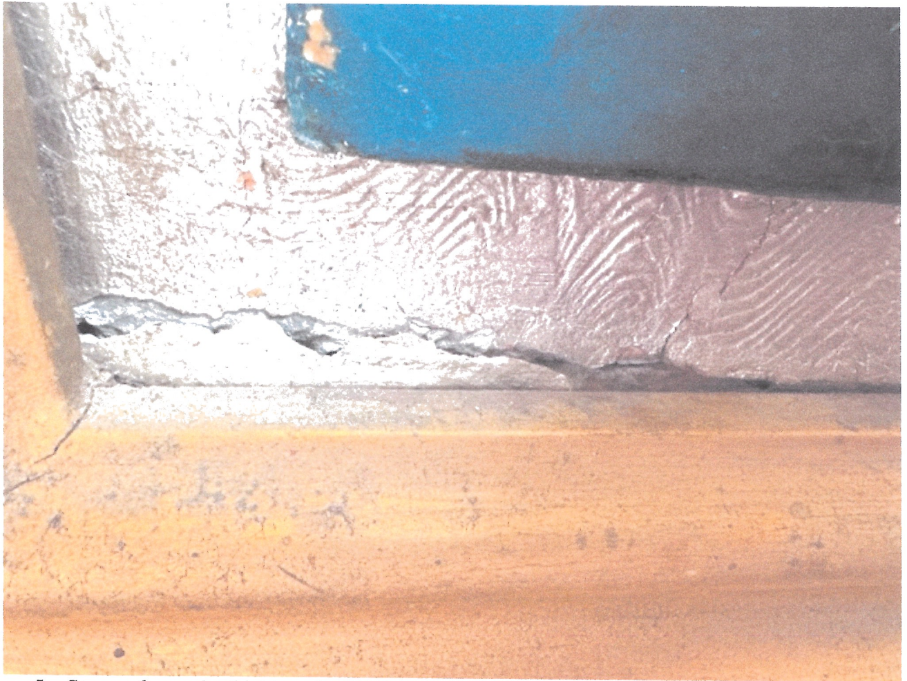
5. Stan zachowania obiektu – detal.