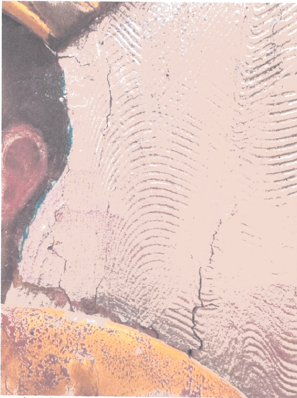
7. Stan zachowania obiektu – detal.

WOJEWÓDZKI URZĄD OCHRONY ZABYTKÓW W WARSZAWIE Delegatura w Ostrołęce 07-400 Ostrołęka, ul. Kościuszki 16 tel./fax (029) 764-22-38