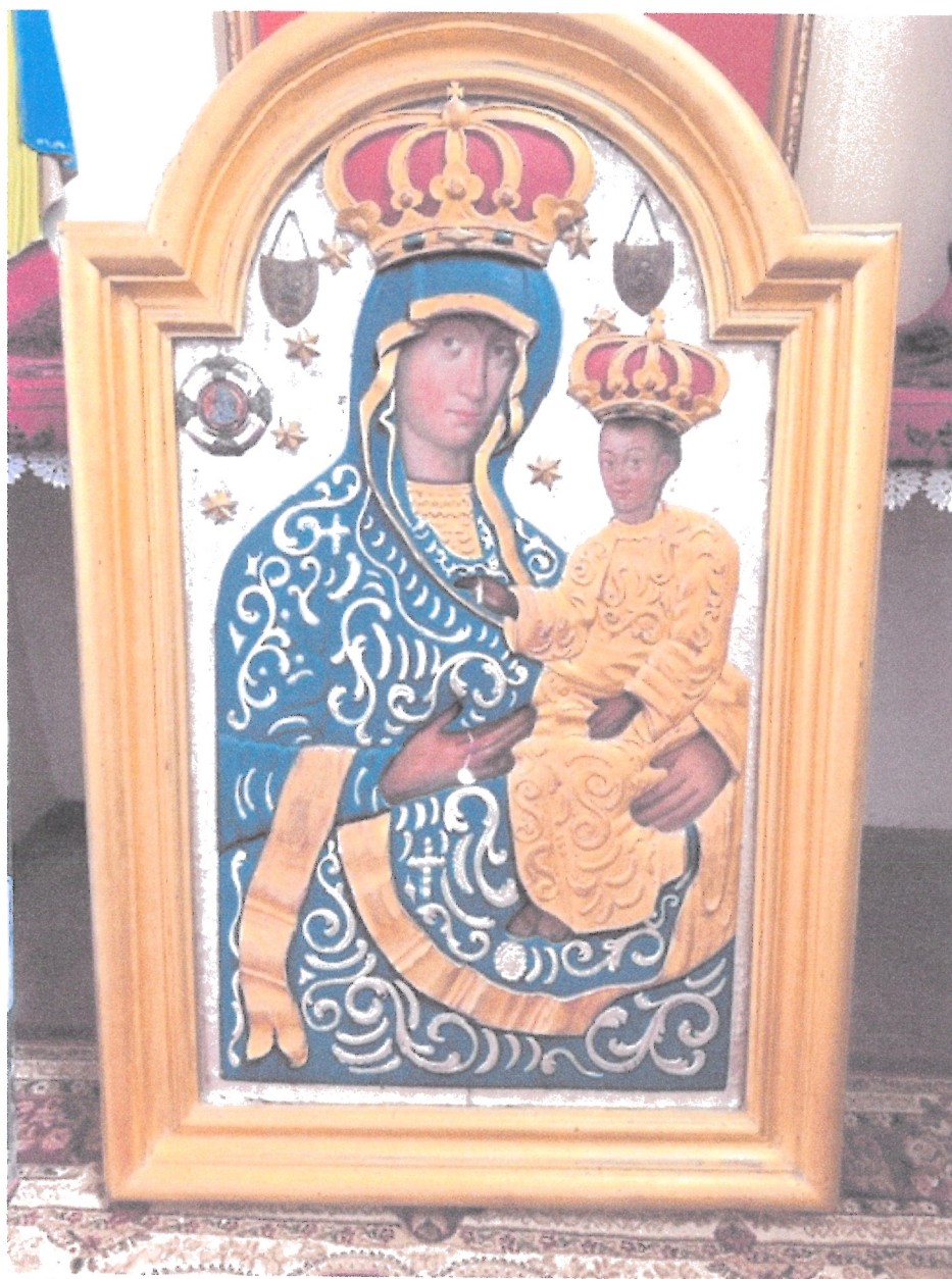
1. Stan obiektu przed konserwacją – lico.

WOJEWÓDZKI URZĄD OCHRONY ZABYTKÓW W WARSZAWIE Delegatura w Ostrołęce 07-400 Ostrołęka, ul. Kościuszki 16 tel./fax (029) 764-22-38