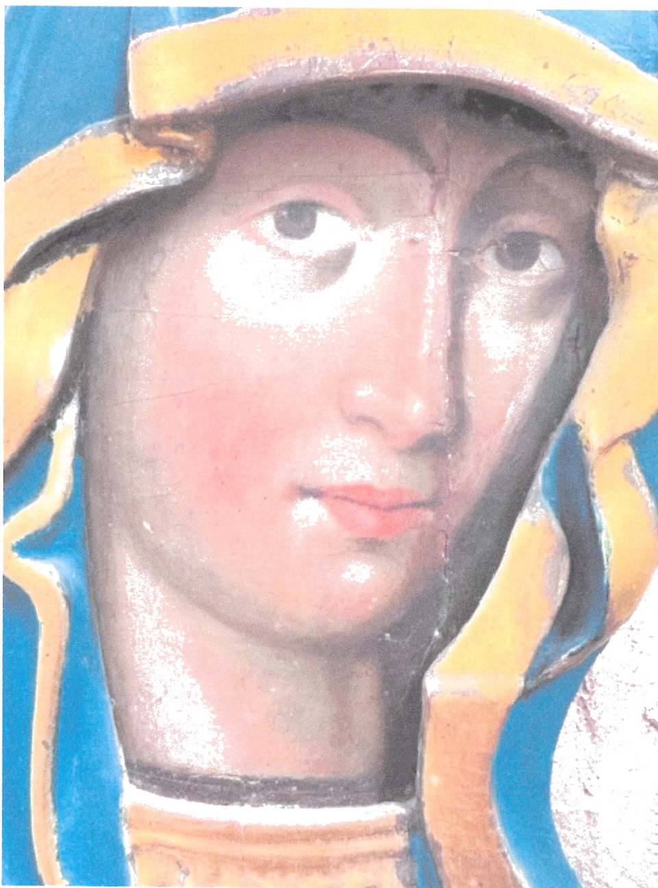
3. Stan obiektu przed konserwacją – detal.

WOJEWÓDZKI URZĄD OCHRONY ZABYTKÓW W WARSZAWIE Delegatura w Ostrołęce 07-400 Ostrołęka, ul. Kościuszki 16 tel./fax (029) 764-22-38