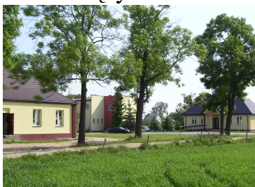
Wymagające odnowy, centrum wsi Karniewo

W ramach tej inwestycji planuje się utwardzenie otwartych placów i chodników w centrum Karniewa będących elementem otwartej przestrzeni służącej integracji społecznej, a także poprawie bezpieczeństwa i swobodnego przemieszczania się mieszkańców wsi Karniewo i innych miejscowości należących do Gminy Karniewo, poprawie komunikacji i dojścia do instytucji