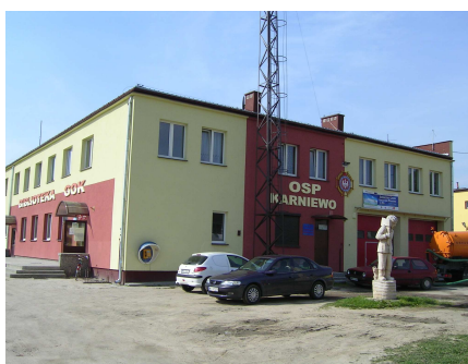
Wymagające utwardzenia centrum wsi Karniewo