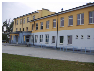
Publiczne gimnazjum im. Jana Pawła II w Karniewie

Poza zabudową mieszkalną we wsi znajduje