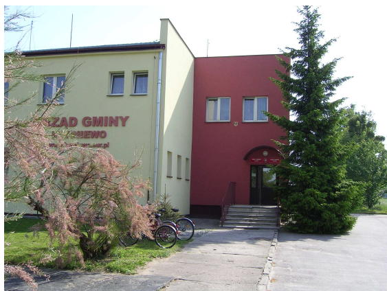
Wymagające utwardzenia centrum wsi Karniewo

Program odnowy wsi składa się z kilku zadań, których realizacja pozwoli mieszkańcom osiągnąć cele założone w wizji rozwoju. Planowane