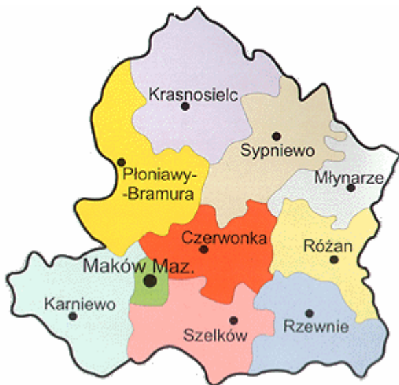
Położenie wsi Karniewo (powiat Maków Mazowiecki)

Karniewo posiada korzystne powiązania z sąsiednimi wsiami i gminami, dzięki dobrze rozwiniętej sieci dróg powiatowych oraz gminnych, które jednocześnie zapewniają łączność lokalną.