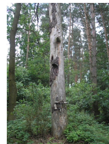
Karniewo – środowisko naturalne